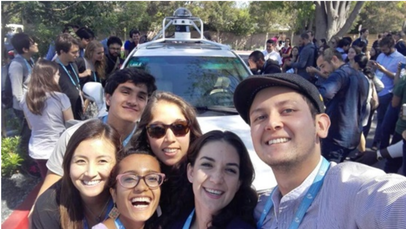
Con el self-driving car! «Spared no expense»

Nuestros ingenieros peruanos, ganadores de la Competencia de Impacto Global (GIC, por sus siglas en inglés) Perú 2015, bloguean desde Singularity University (SU), con sede en el Centro de Investigaciones de la NASA en Silicon Valley, Estados Unidos, contándonos sus experiencias.