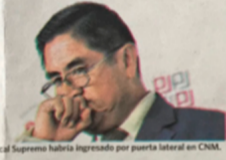
Vocal Supremo habría ingresado por puerta lateral en CNM.

SACAR A CONSEJEROS En otro momento, el expresidente del CNM, Gonzalo García, pidió que se retire a todos los consejeros para evitar especulaciones en las investigaciones que vienen haciendo. “Se están investigando entre ellos mismos, lo recomendable es que saquen a todos para limpiar toda la institución. Vamos a esperar que medidas se tomen en estos días. Esperamos que estas decisiones sean positivas”, señaló.