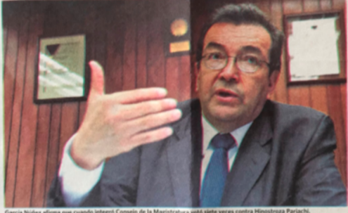
García Núñez afirma que cuando integró Consejo de la Magistratura está siete veces contra Hinostroza Parachi.

Ante la crisis que existe en el Consejo Nacional de la Magistratura (CNM) y el Poder Judicial (PJ), el expresidente del Poder Judicial, Gonzalo García, dijo que el gran problema no se resuelve con destituir a los implicados, sino que se requiere de una nueva Constitución para recuperar la confianza en el Estado. “Se ha llegado al fin de un sistema político que lamentablemente está perjudicando a todo el país. En este momento lo que se requiere son soluciones inmediatas por parte de las autoridades competentes”, dijo el expresidente en el programa de Noticias Locales para radio Exiliana. García Núñez recordó que cuando fue presidente del CNM, en el periodo 2011-2015, dictó el proceso de nombramiento de jueces superiores, en siete oportunidades más en contra de César Hinostroza Parachi, pero cuando dejó el cargo, según la Corte Suprema del Poder Judicial, “nueve veces votamos en contra de Hinostroza, que postulaba como juez superior”. Terminamos nuestro mandato y no sabemos cómo ingresó, quién lo hizo por la puerta lateral”, sostuvo.