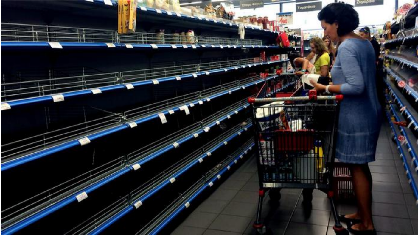
Estantes vacíos en los supermercados griegos, 5 julio 2015