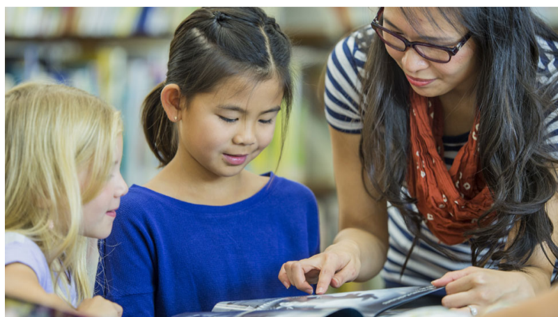
Canadá paga altos salarios de maestros según los estándares internacionales

En lugar de un país de extremos, los resultados de Canadá muestran un promedio muy alto, con relativamente poca diferencia entre los estudiantes con ventajas y desventajas.