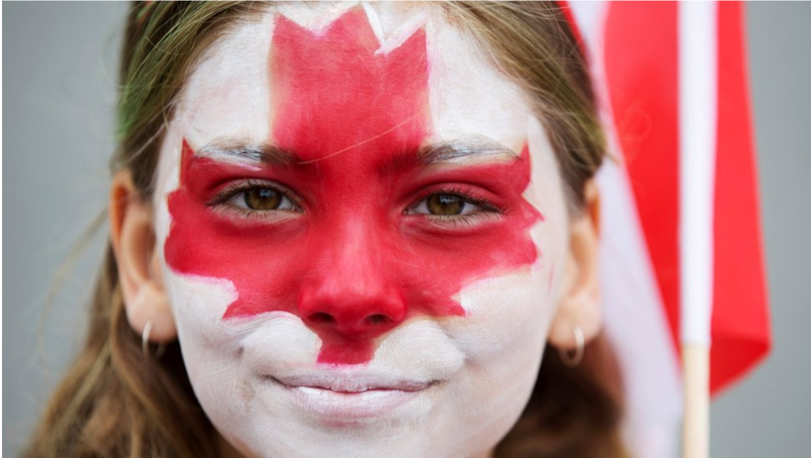
Canadá ha subido al nivel superior de los rankings educativos

Cuando hay debates sobre los mejores sistemas educativos del mundo, los nombres que generalmente se mencionan son los de las potencias asiáticas como Singapur y Corea del Sur o los de los nórdicos, como Finlandia o Noruega.