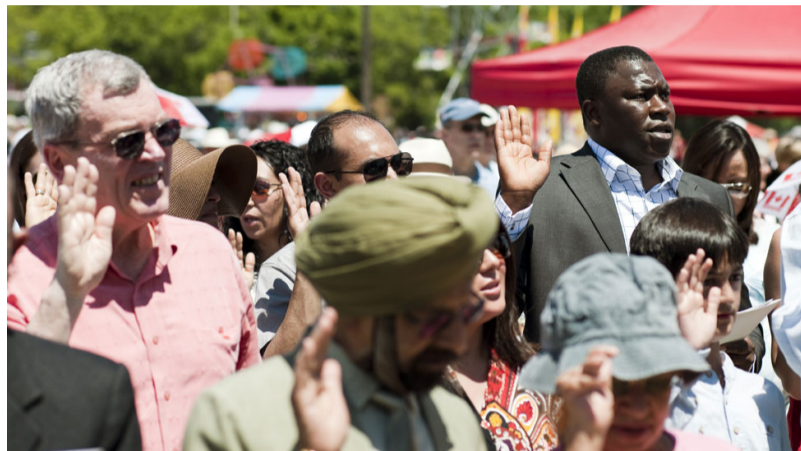
Ceremonia de juramento para nuevos ciudadanos canadienses

Sin embargo, los hijos de familias migrantes recién llegadas, parecen integrarse con suficiente rapidez como para desempeñarse al mismo nivel que sus compañeros de clase.