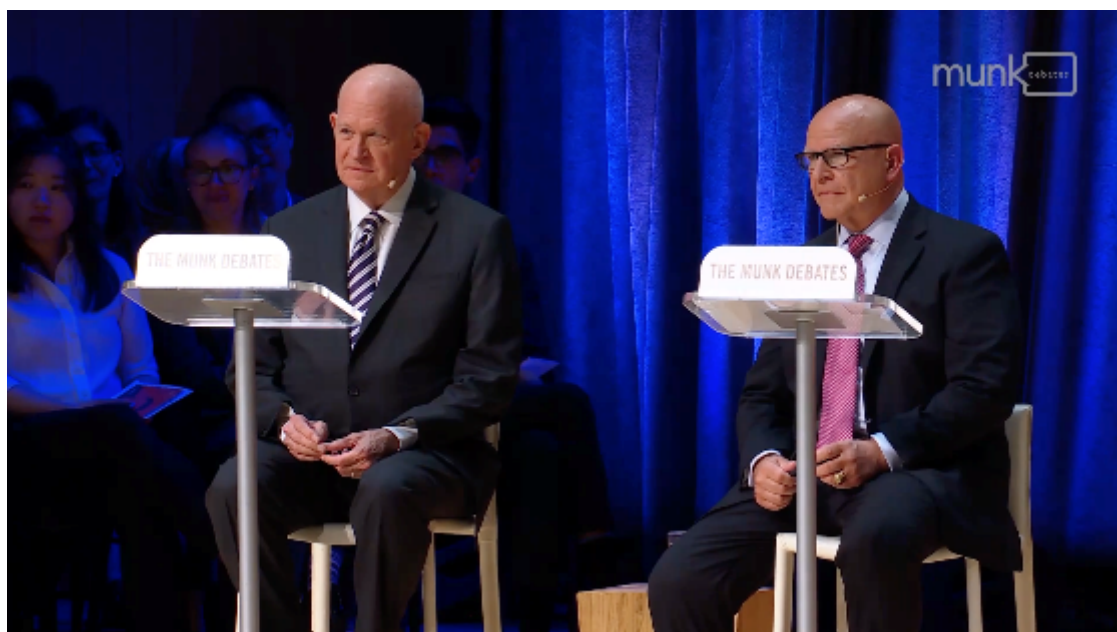
Pillsbury (izquierda) y McMaster (derecha) escuchando mientras Mahbubani hace su intervención.

Argumentando la resolución está H. R. McMaster, un ex Asesor de Seguridad Nacional, así como Michael Pillsbury, uno de los principales asesores sobre China ante el Presidente de los EEUU, Donald Trump.