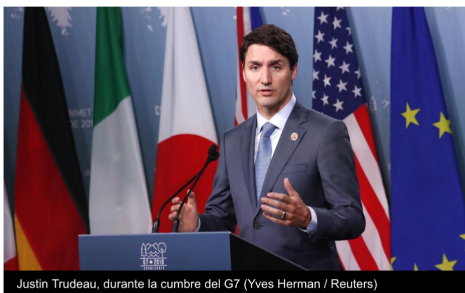
Justin Trudeau, durante la cumbre del G7

El primer ministro canadiense, Justin Trudeau, rechazó frontalmente las declaraciones realizadas por el presidente estadounidense, Donald Trump, y dijo que el nuevo TLCAN no tendrá una cláusula de disolución automática.