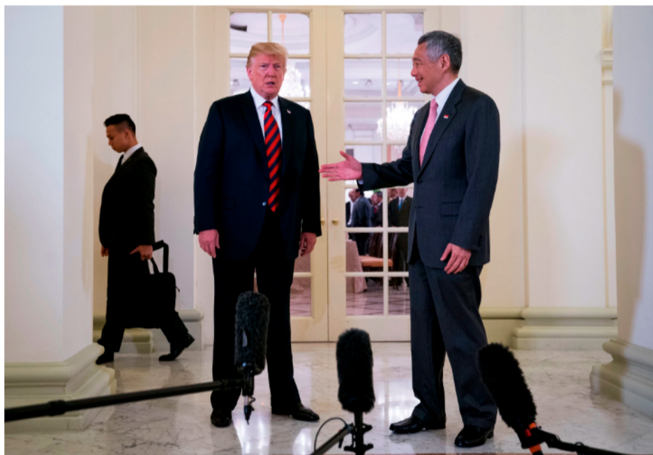
President Trump meeting on Monday with Prime Minister Lee Hsien Loong of Singapore at the Istana, the presidential palace in Singapore. Anticipation grew for Mr. Trump's meeting nearby on Tuesday with Kim Jong-un of North Korea.